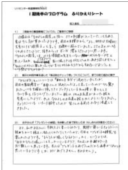
図 1.4 「ふりかえりシート」