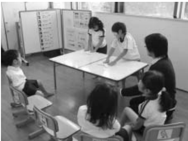
図 1.1 テーブルふきの実体験