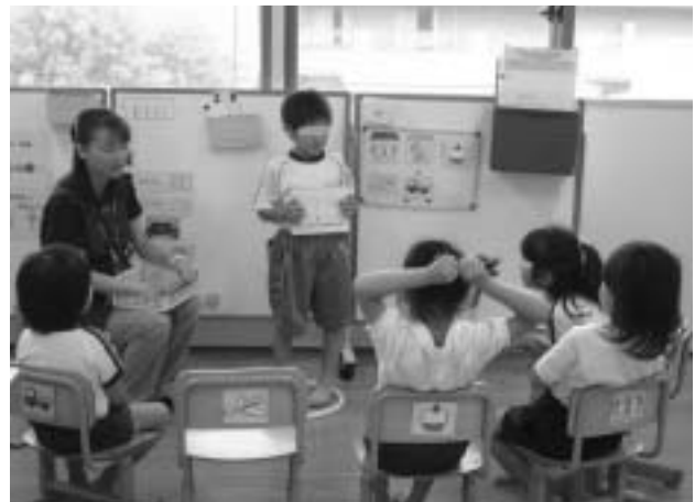
図 1.3 「宿題」の報告