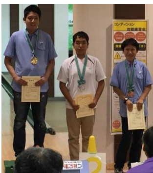
ジュニア男子の部