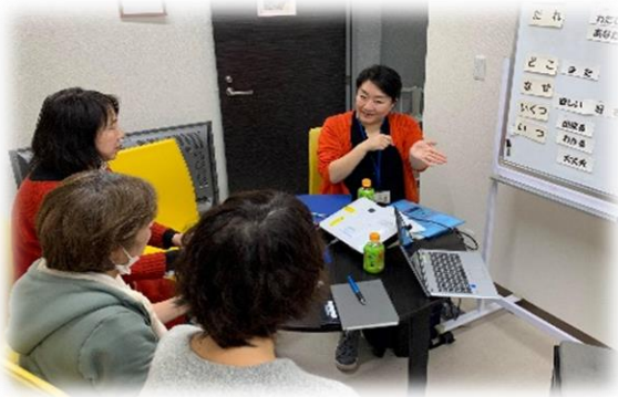
出前講座の様子（ヘルパー事業所）