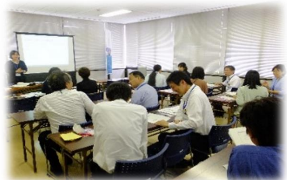
ペアワークの様子（区役所）