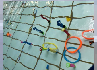
プールあそびランド