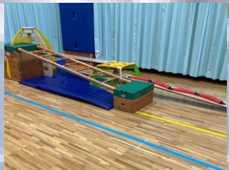
ワクワク運動遊び広場