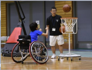
車いすバスケットボール