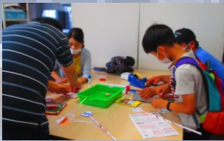
アート体験&工作ひろば