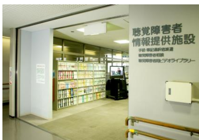
听力障碍者提供信息的设施

具有各种玩具，为残疾儿童当场使用或免费出租，亦有亲子游玩的区域，另举办季节性活动。