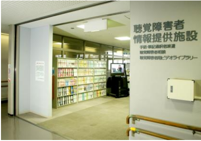
听力障碍人士提供信息的设施

准备了各种玩具。这些玩具可以向有残障的小朋友出租。在这里还可以体验一些在开关上做了改良的电动玩具。在这里还举办一些季节性的活动和培训，以及走出去的玩具出租活动。