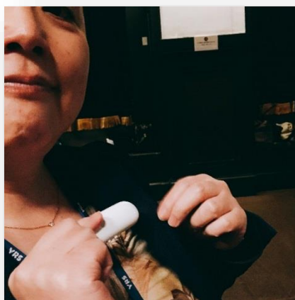
▲Bステージでは小さな装置を使って光と振動を体感しました