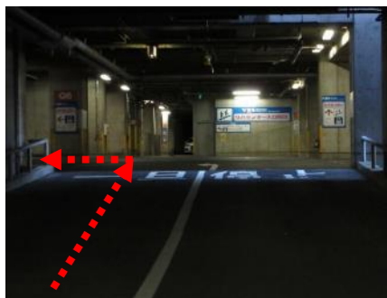
(4) 「一時停止」と「左折」の 道路表示に従い進む