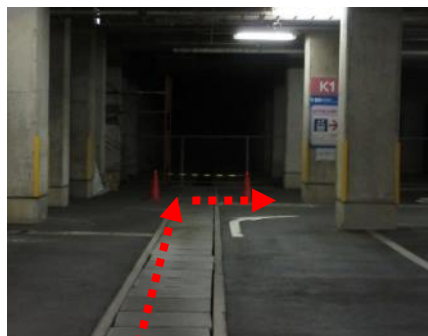
(7) 30mほど直進して、 K1の柱を右折