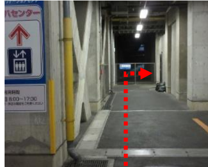
(10) つきあたりまで進み、 右側の自動ドアから入る