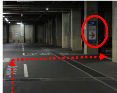
(3) 20mほど進み右折 (看板を目印にお進みください)