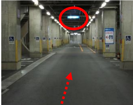
(9) 青色「エレベーター入口」掲示版 この一帯に駐車する