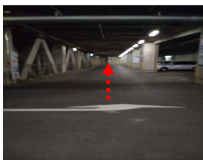
(5) つきあたりまで直進