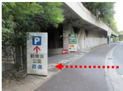
(1) 地下駐車場入口を左折