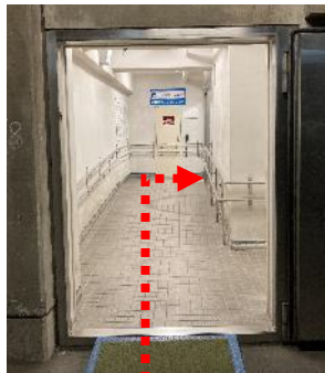
(12) つきあたって右側に エレベーター