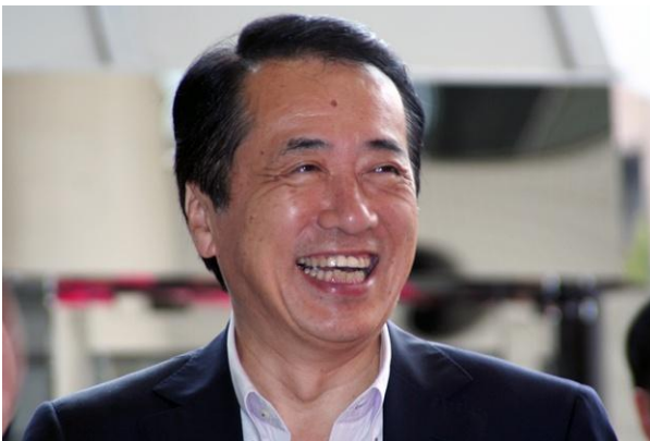
横浜ラポール正面玄関前にて(写真上)

首相の視察来訪に際しまして、当日ご来館いただいた方々には、多大なご協力をいただきました。