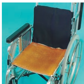
車椅子用アクションパッド アクションジャパン(株)