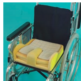
エクスジェルシートクッション (株)加地