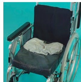
J2クッション (株)アクセスインターナショナル