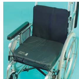
ストレータス (株)ユーキ・トレーディング