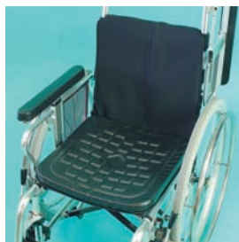
イクスジェル マルチクッションR (株)加地