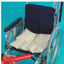
ピアリズム (株)プロップ