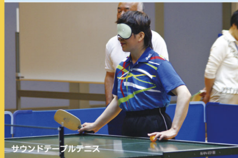
サウンドテーブルテニス