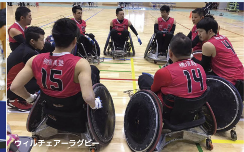
ウィルチェアラグビー