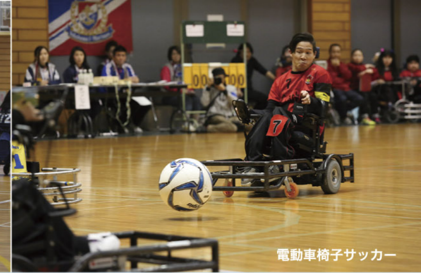
電動車椅子サッカー